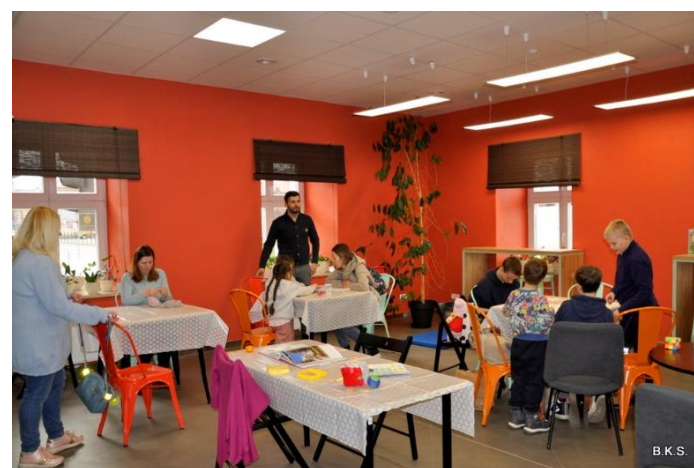
Zajęcia świetlicowe dla dzieci z Ukrainy