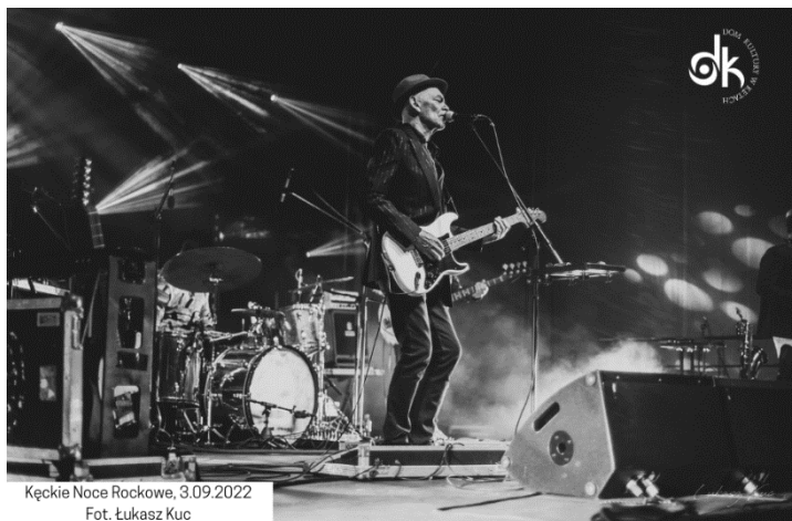
Kęckie Noce Rockowe, 3.09.2022