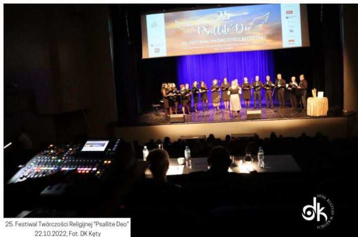
25. Festiwal Twórczości Religijnej "Psallite Deo" 22.10.2022

W roku 2022 odbyło się 586 seansów kina cyfrowego w Domu Kultury w Kętach, które obejrzało 15469 widzów, dodatkowo zorganizowano 11 projekcji KINO Szkoła w których udział wzięło 1300