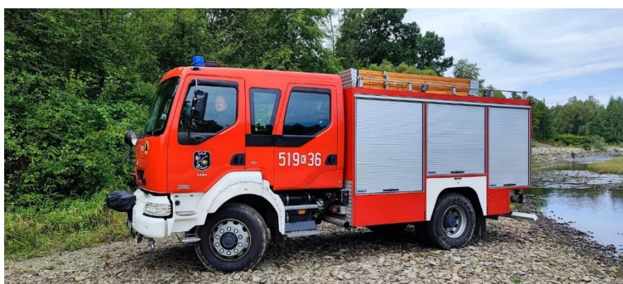
Renault Midlum OSP Kęty Podlesie

Ponadto pozyskano dla OSP Kęty Podlesie przekazany przez KP PSP w Oświęcimiu używany samochód ratowniczo – gaśniczy Renault Midlum, który zastąpił samochód STAR244, jednostka zakupiła również z własnych środków lekki samochód Mitsubishi L200.