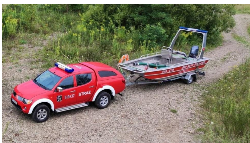
Mitsubishi L200 OSP Kęty Podlesie