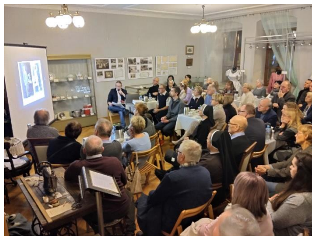
Spotkania przy armacie