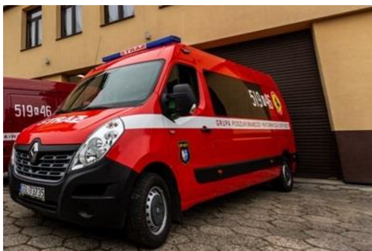
Renault Master OSP Kęty

Ponadto pozyskano dla OSP Kęty Podlesie przekazany przez KP PSP w Oświęcimiu używany samochód ratowniczo – gaśniczy Renault Midlum, który zastąpił samochód STAR244, jednostka zakupiła również z własnych środków lekki samochód Mitsubishi L200.