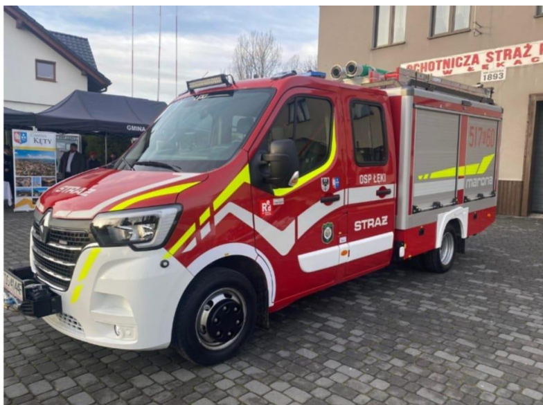
Renault Master OSP Łęki