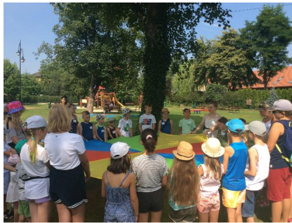
„Akademia Młodego Ekologa”

Do dyspozycji czytelników pozostają 24 komputery (zlokalizowane w bibliotece głównej oraz jej filiach), 6 tabletów oraz 20 e-czytników z nagranyymi książkami.