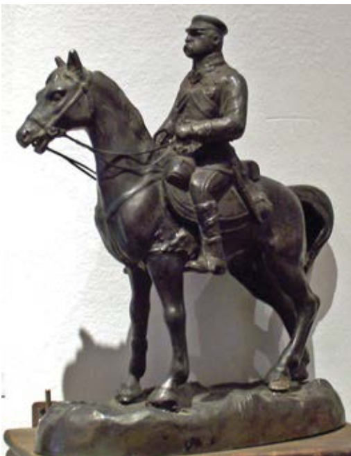
Odlew przedstawiający Marszałka Piłsudskiego na koniu (Zbiory Muzeum im. Aleksandra Kłosińskiego w Kętach)