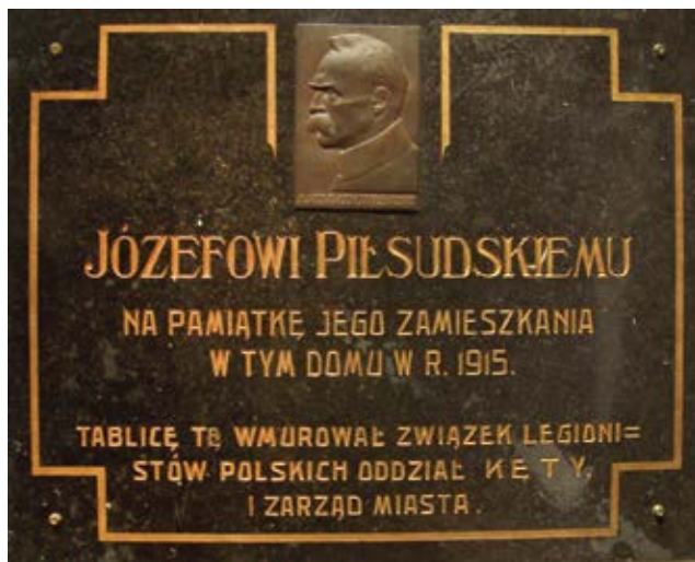
Tablica marmurowa odsłonięta 3 maja 1938 r. upamiętniająca pobyt w Kętach Józefa Piłsudskiego w zimie 1915 roku (Zbiory Muzeum im. Aleksandra Kłosińskiego w Kętach)