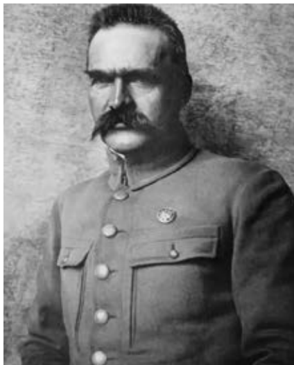
Józef Piłsudski, zdjęcie z lat I wojny światowej

Na początku I wojny światowej Piłsudski na czele oddziałów strzeleckich wkroczył do Królestwa Polskiego, próbując bezskutecznie wywołać antyrosyjskie powstanie. W 1914 roku został mianowany komendantem I Brygady Legionów Polskich, powołał również do życia Polską Organizację Wojskową, której konspiracyjne struktury powstały na terenie Królestwa Polskiego. Wobec odmowy złożenia przysięgi na wierność władcom państw centralnych komendant został latem 1917 r. osadzony w twierdzy magdeburgskiej. Po opuszczeniu miejsca aresztowania Piłsudski objął w listopadzie 1918 r. urząd Naczelnika Państwa. Był również organizatorem odrodzonego Wojska Polskiego oraz Wodzem Naczelnym w zwycięskiej wojnie z bolszewikami. W 1923 r. zrezygnował z piastowania wszelkich funkcji