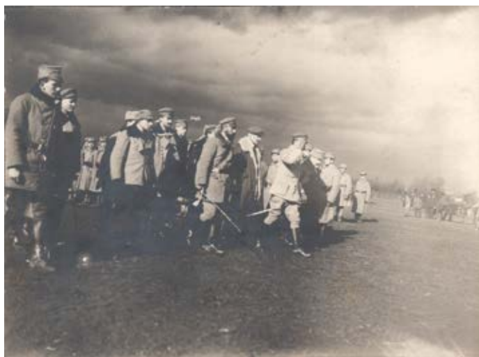
Uroczystość z udziałem Józefa Piłsudskiego, która odbyła 15 lutego 1915 roku na kamienicach miejskich w Kętach. W jej trakcie odznaczono ponad 140 legionistów za bitwę pod Łowczówkiem.

Komendant odczytał listę udekorowanych, dowódcy prześlą nazwiska tych, którzy są w ich jednostkach oraz wiadomości o rannych (...) Przechodzimy obecnie chwilę przelotową. Komendant jest w obawie, żebyśmy sami swym postępowaniem nie zaszkodzili. Często zarzucają nam, słusznie i niesłusznie czasami nieodpowiedni system współżycia z otoczeniem, brak żołnierskiej sprężystości na zewnątrz, brak dyscypliny zewnętrznej (...) Komendant poleca powściągać te przejawy u żołnierzy i u oficerów. Dowódcy mają to podnieść na swych odprawach. Poleca salutować oficerów austriackich przez naszych żołnierzy. Naszych oficerów wezwać do salutowania starszych oficerów austriackich, co do równych i młodszych wobec ich nieodpowiedniego zachowania się względem nas, zostawia komendant do uznania w zależności od sytuacji.