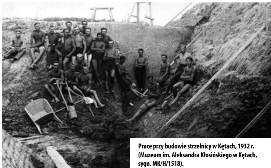
Prace przy budowie strzelnicy w Kętach, 1932 r. (Muzeum im. Aleksandra Kłosińskiego w Kętach, sygn. MK/H/1518).