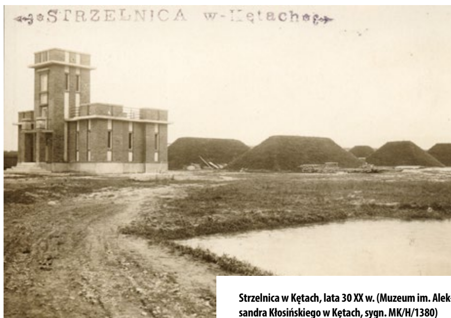
Strzelnica w Kętach, lata 30 XX w.