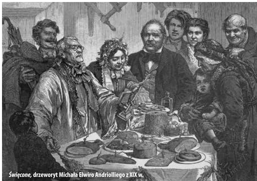
Święcone, drzeworyt Michała Elwiro Andriollego z XIX w.

Święta wielkanocne, upamiętniające zmartwychwstanie Chrystusa, to najważniejsze święta wśród chrześcijan. Poprzez je okres wielkiego postu, który w Kościele rzymskokatolickim zaczyna się w Środę Popielcową i trwa aż do Wielkiej Soboty. Jest to wyjątkowy czas w kalendarzu liturgicznym. Od wieków Kościół zalecał wtedy swoim wiernym czynienie pokuty i postów w celu godniejszego przeżycia świąt wielkanocnych.