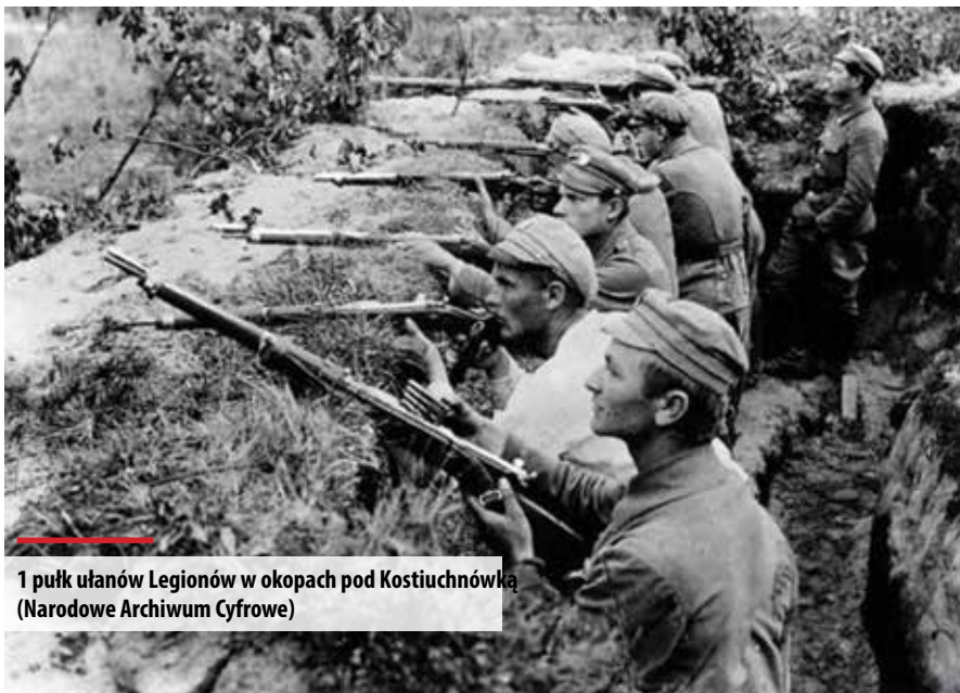
1 pułk ułanów Legionów w okopach pod Kostiuchnówką

W powstrzymaniu carskiej ofensywy na Wołyniu wzięły udział wszystkie trzy brygady Legionów Polskich. Latem 1916 roku najsilniejsze zgrupowanie polskich oddziałów znalazło się pod wsią Kostiuchnówka. Przez kilka miesięcy Polacy przygotowywali tam pozycje obronne. Legioniści wzniesli w tym rejonie silne umocnienia, którym nadali charakterystyczne nazwy, m.in.: „Reduta Piłsudskiego” (przed pozycjami 5 pułku Legionów), „Polska Góra” („Polenberg”), „Polski lasek”. Na bagnistym dopływie do stru-