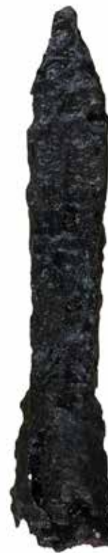
Inwentarz artystyczno-historyczny Muzeum im. Aleksandra Kłosińskiego w Kętach, sygn. MK/H/2004.