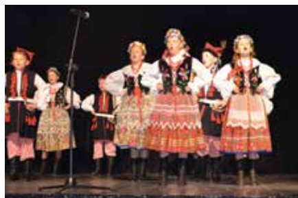
Zespół Pieśni i Tańca „Małe Kęty”