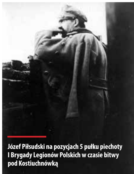
Józef Piłsudski na pozycjach 5 pułku piechoty I Brygady Legionów Polskich w czasie bitwy pod Kostiuchnówką

mienia Garbach znajdował się też „Polski mostek” (Polenbrücke). Za głównymi pozycjami obronnymi zostało wybudowane drewniane miasteczko nazwane Legionowo.