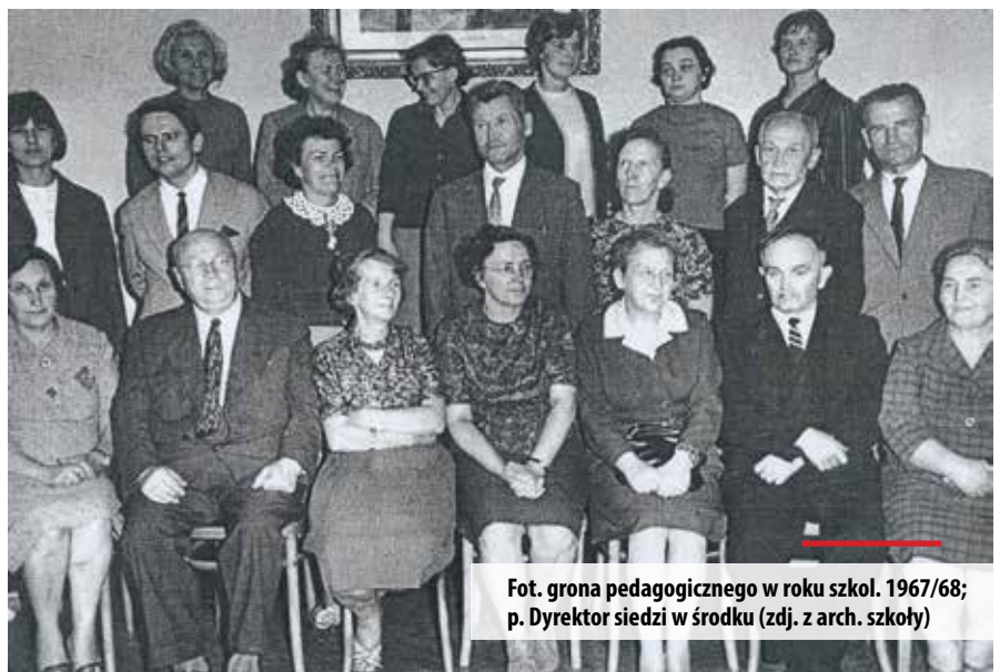
Fot. grona pedagogicznego w roku szkol. 1967/68; p. Dyrektor siedzi w środku