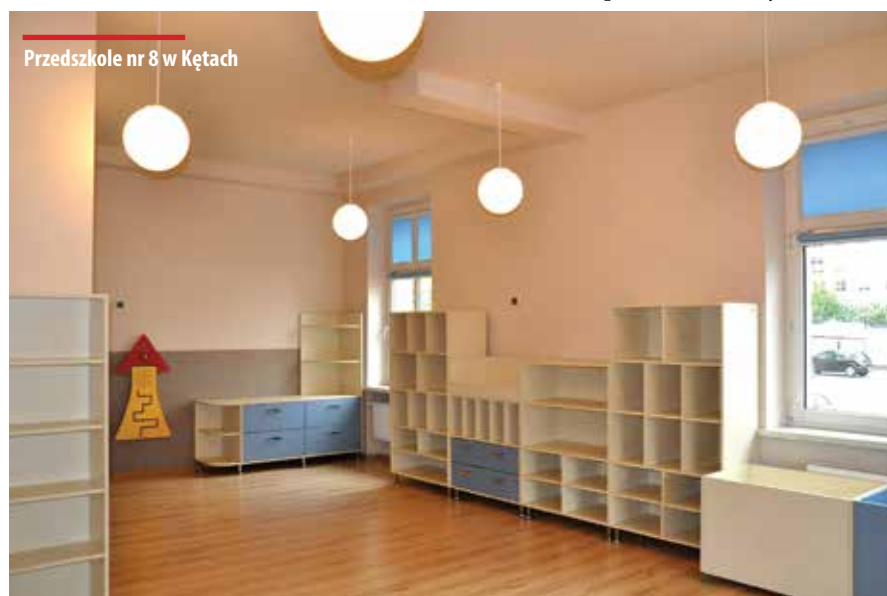
Przedszkole nr 8 w Kętach

Całkowity koszt inwestycji finansowany był ze środków własnych placówki.