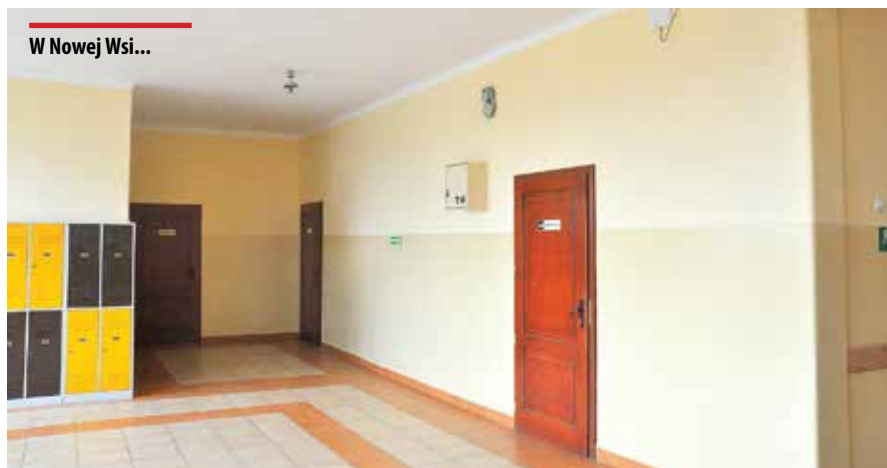
W Nowej Wsi...