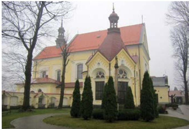
Klasztor Franciszkanów (Reformatów) w Kętach.