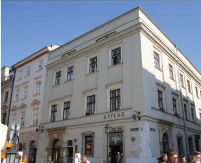
Kamienica „Pod Gruszką” na rogu ulic Sławkowskiej i Szczepańskiej w Krakowie zakupiona pod koniec XVII w. przez Andrzeja Żydowskiego