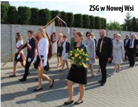
ZSG w Nowej Wsi