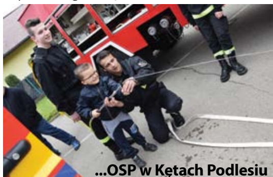
...OSP w Kętach Podlesiu

Po raz pierwszy można było zobaczyć w akcji nasz najnowszy nabytek - zestaw narzędzi hydraulicznych do ratownictwa technicznego. Zakupiony został dzięki Waszemu wsparciu w ramach środków Budżetu Obywatelskiego. DZIĘKUJEMY!