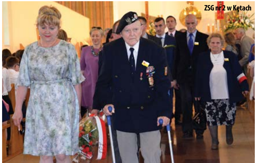
ZSG nr 2 w Kętach