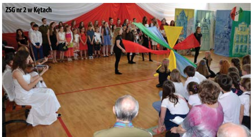
ZSG nr 2 w Kętach