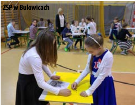
ZSP w Bulowicach