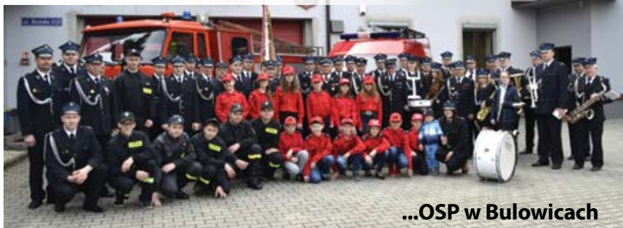
...OSP w Bulowicach

3 maja o godz. 11.00 w kościele pw. św. Wojciecha w Bulowicach odbyła się Msza Święta w intencji strażaków oraz ich rodzin z okazji Dnia Strażaka. Z tej okazji został także złożony znicz na cmentarzu za wszystkich zmarłych strażaków. Po uroczystym apelu przed remizą rozpoczął się kolejny dzień otwarty naszej jednostki. Zwiedzający mogli zapoznać się ze sprzętem, jakim dysponujemy, zaznajomić się z jego obsługą oraz poznać techniki działania. Dzieci mogły spróbować swoich sił na tyrolce, wspinając się po drobne słodkości, zrobić sobie zdjęcie w ubraniu specjalnym, a także poszaleć na dmuchanej zjeżdźalni. Ponadto zainicjowany został pokaz ratownictwa technicznego oraz medycznego.