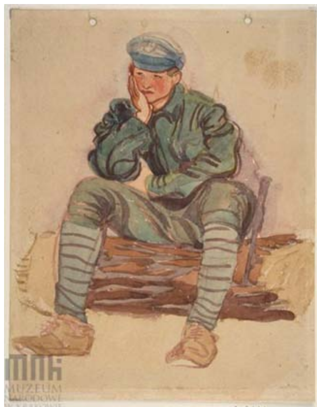
Poniżej: Akwarela Wilhelma „Wilka” Wyrwińskiego Legionista, 1916 r. (Muzeum Narodowe w Krakowie)