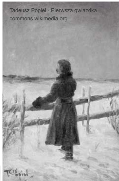
Tadeusz Popiel - Pierwsza gwiazdka

Na koniec warto opowiedzieć o najbardziej osobliwym z bożonarodzeniowych zwyczajów dawnych Kęt. Rytuał ten pielęgnowała przede wszystkim służba domowa, posługująca u bogatszych mieszczan. Otóż, gdy wszyscy sąsiedzi zasiedli już do wigilijnej wieczerzy, wówczas parobkowie odwiedzali w tajemnicy pobliskie domy, wynosząc po kryjomu różne sprzęty z mieszkań lub też zabudowań gospodarczych. Jeśli taka wyprawa po łupy zakończyła się sukcesem, była to znakomita wróżba szczęścia na nadchodzący rok. Najczęściej zagrabione w ten sposób przedmioty wracały do swoich prawowitych właścicieli zaraz po Świętach. Bywało jednak i tak, że zdobywcy zatrzymywali sobie już na