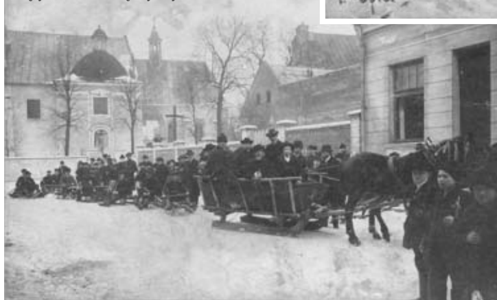
Kęty, 20-lecie międzywojenne

stałe zdobyte łupy. Niewątpliwie, był to jeden z najbardziej osobliwych elementów świata bożonarodzeniowego folkloru dawnej Małopolski. Świąta, który w większości odszedł już do historii.