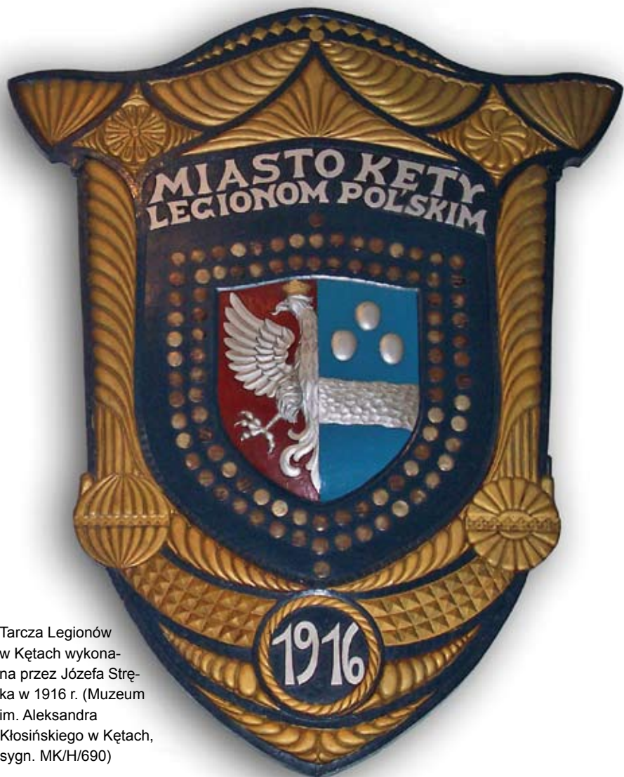
Tarcza Legionów w Kętach wykonana przez Józefa Stręka w 1916 r. (Muzeum im. Aleksandra Kłosińskiego w Kętach, sygn. MK/H/690)