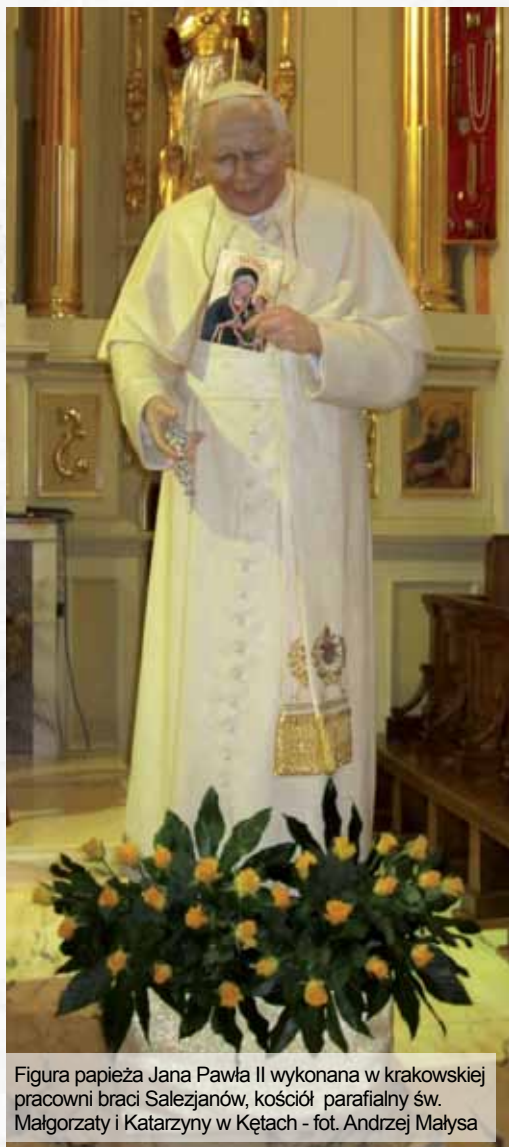
Figura papieża Jana Pawła II wykonana w krakowskiej pracowni braci Salezjanów, kościół parafialny św. Małgorzaty i Katarzyny w Kętach