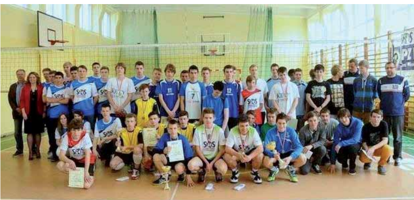
Najlepsze zespoły chłopców