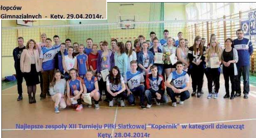
Najlepsze zespoły XII Turnieju Piłki Siatkowej "Kopernik" w kategorii dziewcząt Kęty, 28.04.2014r

W zawodach wzięło udział łącznie aż 180 zawodniczek (27 zespołów) i zawodników (22 zespoły). Uczestnikami turnieju byli reprezentanci 19 gimnazjów z różnych szkół powiatów woje-