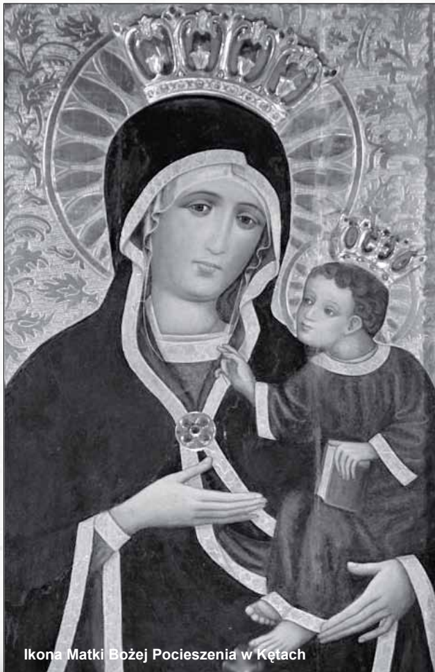
Ikona Matki Bożej Pocieszenia w Kętach

Dlaczego taki właśnie wizerunek pojawił się w kęckim kościele i w wielu innych katolickich świątyniach w Polsce? Zwróćmy uwagę na jeden szczegół. Obraz Matki Boskiej Pocieszenia powstał w XV wieku, a więc w okresie, kiedy to wzorce kultury chrześcijańskiego Wschodu były w Małopolsce bardzo popularne. Na czasy panowania króla Władysława Jagiełły przypadł prawdziwy rozkwit sztuki bizantyńsko-ruskiej. Władca ten, urodzony i wychowany w bardzo mocno zruszczonym Wielkim Księstwie Litewskim, uważał wschodnią stylistykę za najwłaściwszą dla ozdabiania także i katolickich świątyń. Bardzo chętnie sprowadzał do Królestwa Polskiego twórców z Rusi, fundując przepiękne malowidła. Moda na sztukę bizantyńską panowała także w czasach syna Jagiełły, Kazimierza Jagiellończyka. Stąd też w niejednym ozdabianym w tym czasie kościele zachowały się dzieła, które na pierwszy rzut oka nie powinny się tam znaleźć. Do