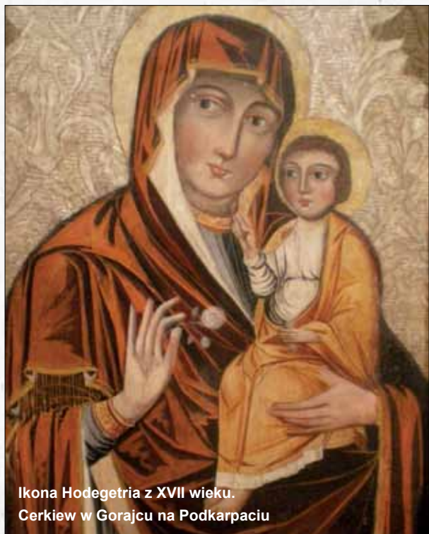
Ikona Hodegetria z XVII wieku. Cerkiew w Gorajcu na Podkarpaciu

dzisiaj zachwyty budzą freski ruskich artystów w kaplicy zamkowej w Lublinie, katedrze w Sandomierzu czy katedrze na Wawelu, gdzie artyści z Rusi ozdobili wnętrza kaplicy grobowej Jagiellończyka.