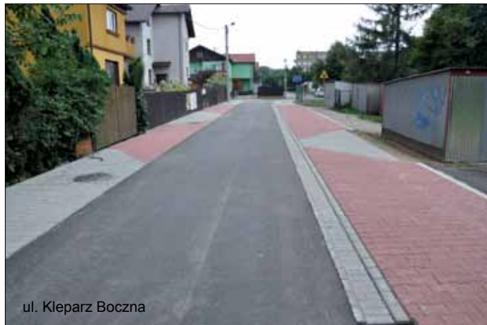
ul. Kleparz Boczna

13 sierpnia w Bulowicach dokonano odbioru zadania wybranego do realizacji w ramach