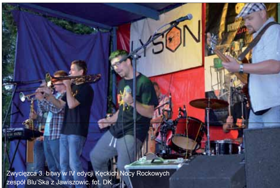
Zwycięzca 3. bitwy w IV edycji Kęckich Nocy Rockowych zespół Blu'Ska z Jawiszowic.

W sumie podczas tegorocznej edycji KNR wstępnie zaplanowano 6 bitew. Finał odbędzie się 27 września podczas Finałowego Pożegnania Lata. Finałowemu jury przewodniczyć będzie Marek Piekarczyk, który również wystąpi z koncertem.