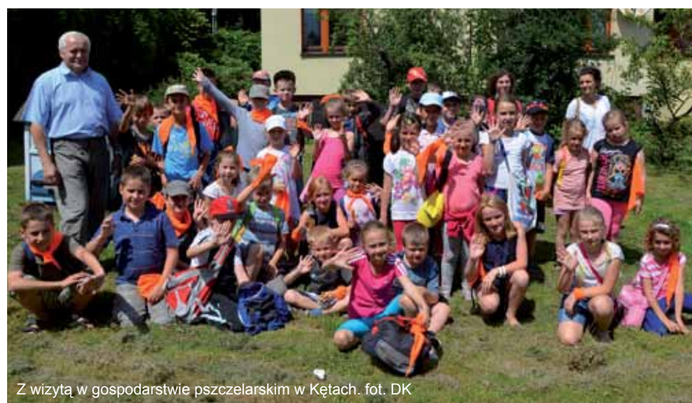
Z wizytą w gospodarstwie pszczelarskim w Kętach.

W ramach Wakacyjnej Akademii swoją działalność wznowiło Letnie Kino Bajka. Tegoroczny repertuar objął takie filmy, jak: „Samoloty 2 – 3D”, „Piłkarzyki rozrabiają”, „Muppety poza prawem” oraz „Gang wiewióra 3D”. Również bogata była oferta wycieczek dla dzieci. Można było się wybrać m.in. do Dream Parku w Ochabach, „Mini ZOO Kucyk” w Inwałdzie, Smo-