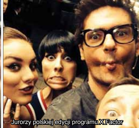
Jurorzy polskiej edycji programu X Factor

Jedną z najlepiej rozpoznawalnych spośród wszystkich grupowych sweetfoci w historii jest portret trojga młodych ludzi, którym udało się zrobić zdjęcie z... papieżem Francisz-