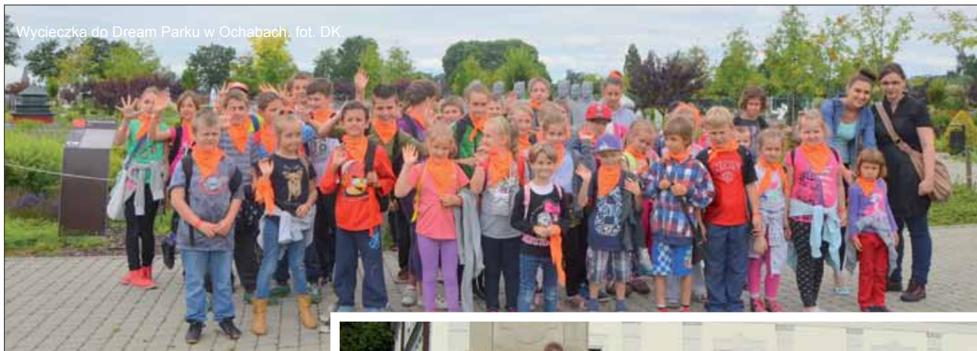
Wycieczka do Dream Parku w Ochabach.

kolejką ze Starego Smokowca na Hrebieniok, zwiedzanie Muzeum Tatrzańskiego Parku Narodowego oraz Ogrodu Botanicznego w Łomnicy Tatrzańskiej, a także zwiedzanie Popradu wraz ze Spiską Sobotą – odrestaurowaną niedawno dzielnicą miasta o wyjątkowym uroku. Trzeba dodać, że to nie koniec ciekawych wypraw w tym roku. Kolejne zaplanowano we wrześniu i w październiku.