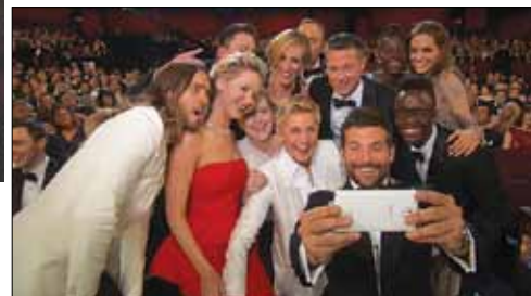
Największe gwiazdy kina i telewizji podczas gali rozdania Oscarów 2014

kiem. Fotografia stała się nie tylko niezwykle oryginalną pamiątką z Watykanu – to przede wszystkim symbol otwartości głowy Kościoła Katolickiego na nowe technologie i trendy. Z kolei na początku tego roku świat mediów aż huczał od plotek na temat selfie wykonanego podczas oscarowej gali tabletem Ellen DeGeneres – prowadzącej znany amerykański program rozrywkowy, a samo zdjęcie obiegło glob w ułamku sekundy od publikacji.