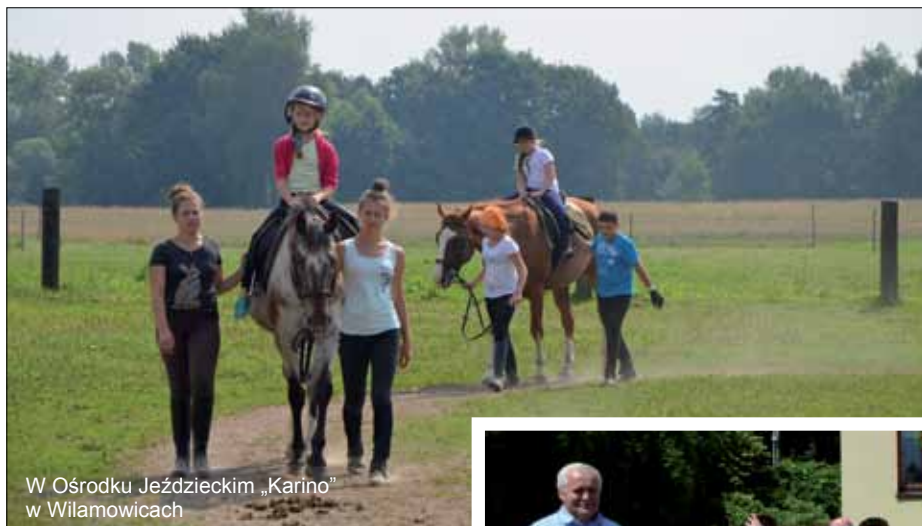
W Ośrodku Jeździeckim „Karino” w Wilamowicach

Tradycyjnie też specjalną ofertę przygotował Dom Kultury dla miłośników turystyki. Jeszcze w czerwcu wycieczkowy sezon zainaugurowała wyprawa do Tarnowa i niezwykle malowniczej wsi Zalipie. Kolejnym celem (12-13 lipca) były perła polskiego renesansu – Zamość oraz Roztocze. W sobotę 9 sierpnia natomiast trasa powiodła na słowackie Podtatrze. W wy-