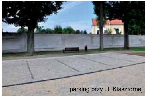
parking przy ul. Klasztornej