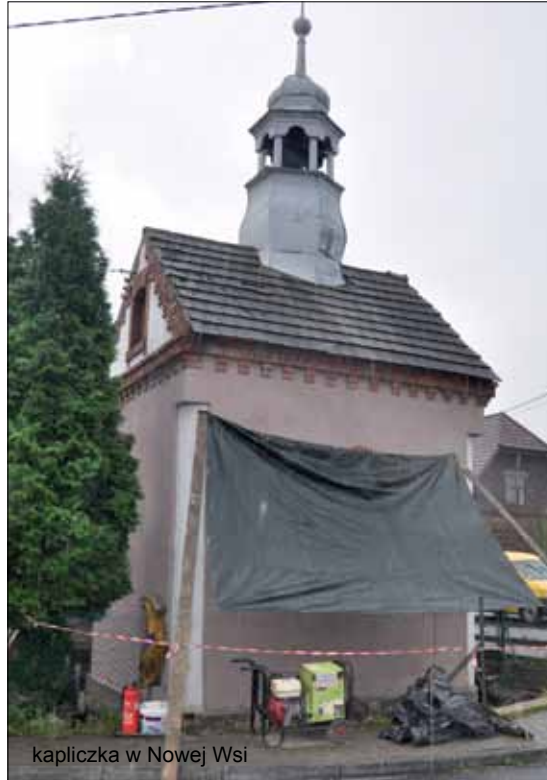
kapliczka w Nowej Wsi

placu budowy pod wykonanie chodnika przy drodze krajowej nr 52 w Bulowicach. Planowo prace potrwać do połowy grudnia. Na tym odcinku należy liczyć