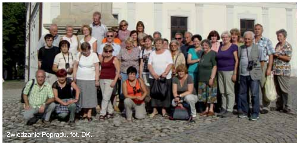
Zwiedzanie Popradu.

Z kolei adepci sztuki fotografowania mogli wziąć udział w plenerze fotograficznym zorganizowanym przez działającą od roku przy Domu Kultury pod opieką jego dyrektora Koło Fotograficzne „Pryzmat”. Wyjazdowi, który miał miejsce w dniach 8-9 sierpnia, towarzyszyło hasło „Z bliska i z daleka”. Celem wy-