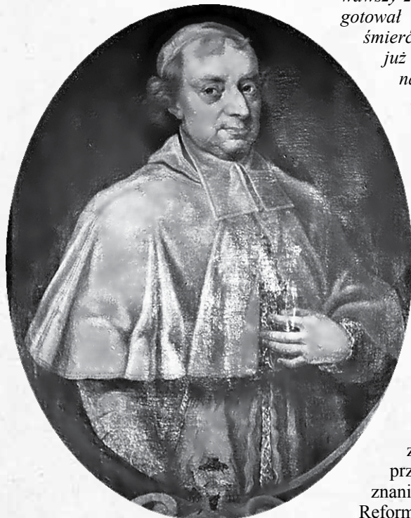
Biskup krakowski Kazimierz Łubieński

W poprzednim numerze „Kęczanina” przedstawiono działania związane z fundacją klasztoru franciszkanów w Kętach, zwieńczone konsekracją kościoła klasztornego przez biskupa krakowskiego Kazimierza Małachowskiego. Niniejszy artykuł w sposób zwięzły przedstawia historię franciszkanów w XVIII i XIX w.