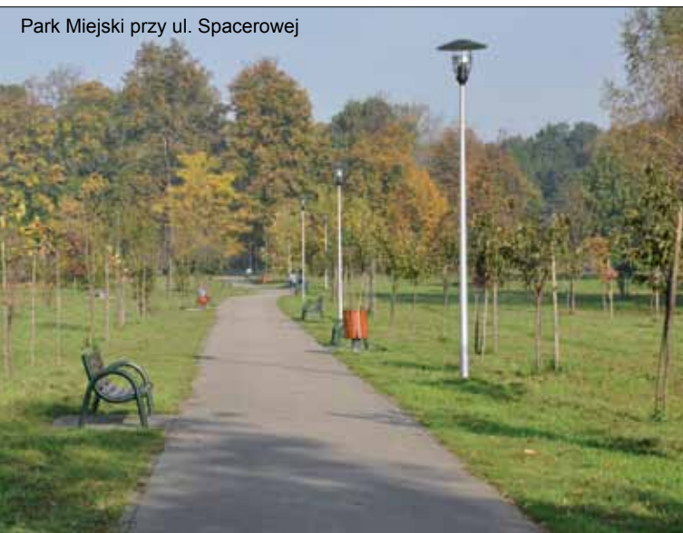
Park Miejski przy ul. Spacerowej

• Uroczysta Gala „Przyjaciołom Kultury” Od kilku lat w styczniu w kęckim Domu Kultury organizowana jest uroczysta, noworoczna Gala dla wszystkich miłośników i przyjaciół kultury. Mecenasi, opiekunowie i animatorzy, którzy w roku