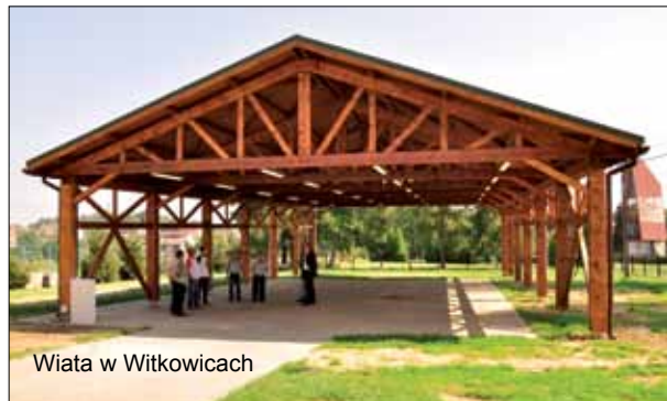
Wiata w Witkowicach

We współpracy z Powiatem wykonano remont na dł. 910 m, wymieniono nawierzchnię i pobocze.