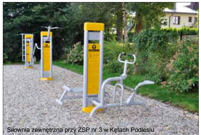
Siłownia zewnętrzna przy ZSP nr 3 w Kętach Podlesiu