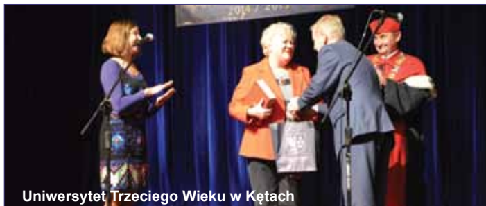
Uniwersytet Trzeciego Wieku w Kętach