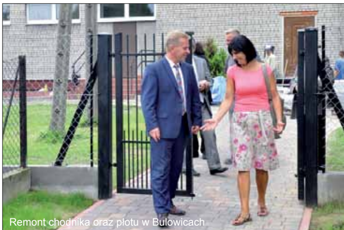
Remont chodnika oraz płotu w Bulowicach