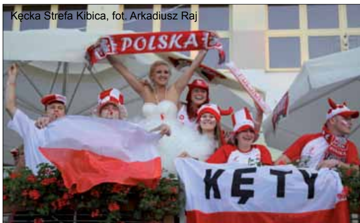
Kęcka Strefa Kibica