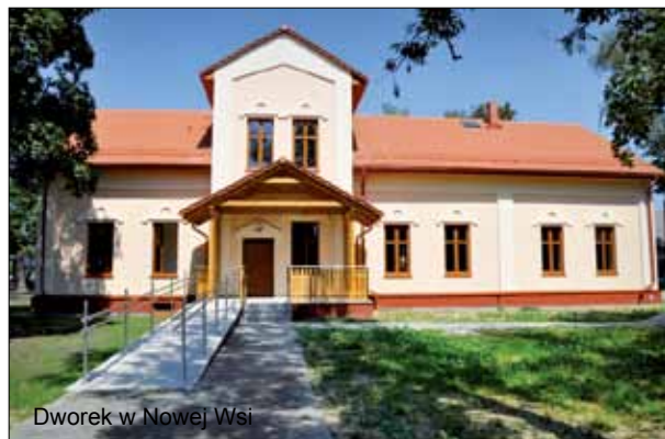
Dworek w Nowej Wsi