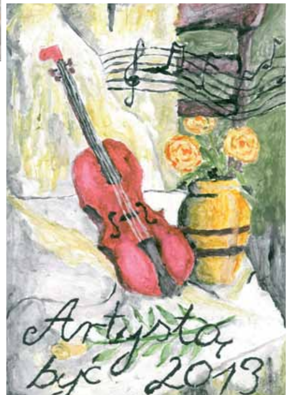
Zwycięska praca Klaudii Kołaczek