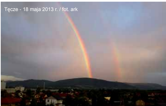
Tęcze - 18 maja 2013 r.