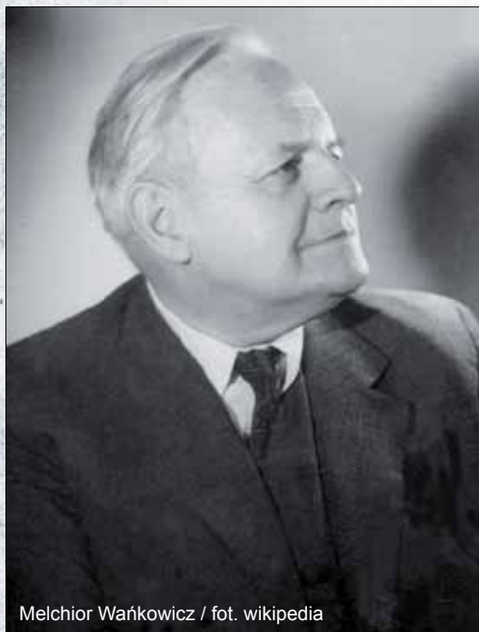
Melchior Wańkowicz

Wiele już napisano i jeszcze napisze się o pamiętnym roku 1939. Powstały setki, jeśli nie tysiące opracowań, relacji, utworów literackich. Opowiadają one zarówno o zmaganiach frontowych żołnierzy, jak i losach zwykłych ludzi, których życie wojna wyrzuciła do góry nogami. Świadkowie tamtych wydarzeń często też wracają pamięcią do ostatnich dni pokoju w lipcu i sierpniu 1939 roku. Było to nadzwyczajualne i burzliwe lato – i dosłownie, i w przenośni. W całej Polsce stawiano sobie nieustannie pytania: Będzie wojna? Czy też nie będzie wojny? Wspomnienia, które przybliżają atmosferę tamtego czasu, podkreślają wiszące w powietrzu napięcie, obawy, że zbiera się potężna burza dziejowa, której trzeba stawić czoła. Niepokojowi o swój własny los towarzyszyło poczucie obowiązku niesienia wszelkiej pomocy i datków dla wojska, które było prawdziwą ozdobą i chlubą międzywojennej Polski. Wojska, które mimo ogromnych ofiar społeczeństwa i wspaniałego ducha bojowego, wojnę tę miało przegrać.