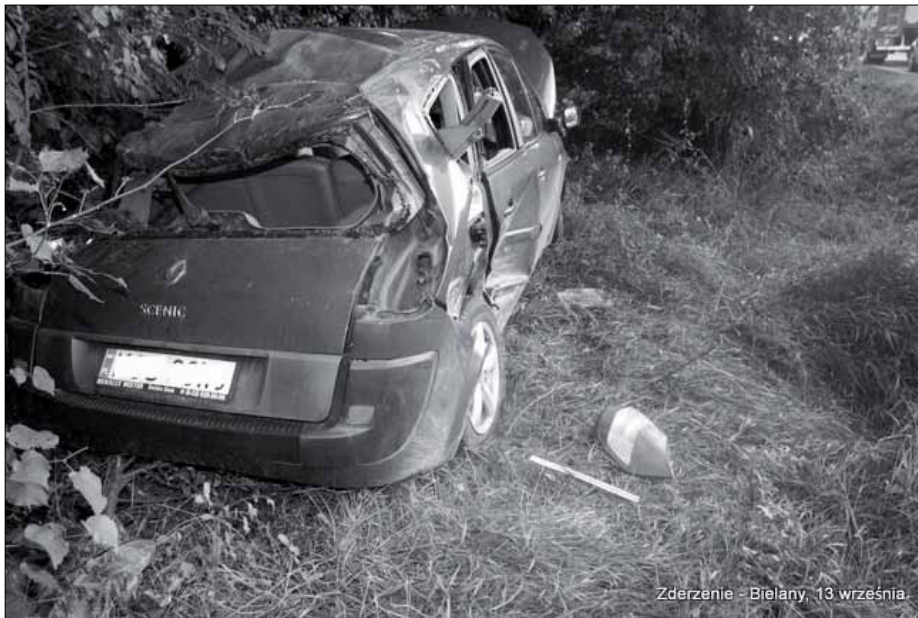
Zderzenie - Bielan, 13 września