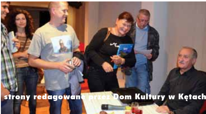
strony redagowane przez Dom Kultury w Kętach

26 września odbył się Przegląd filmów podróżniczych, podczas którego zaprezentowano widzom filmy takie, jak: „Niech żyją Antypody” i „Kukuczka”. Pierwszy z nich prezentował niezapomniane obrazy Entre Rios w Argentynie i Szanghaju w Chinach. Te dwa miasta są antypodami - znajdują się dokładnie po przeciwległych stronach globu. Natomiast drugi film to historia największego polskiego himalaisty - Jerzego Kukuczki opowiedziana słowami jego przyjaciół, rodziny oraz innych himalaistów.