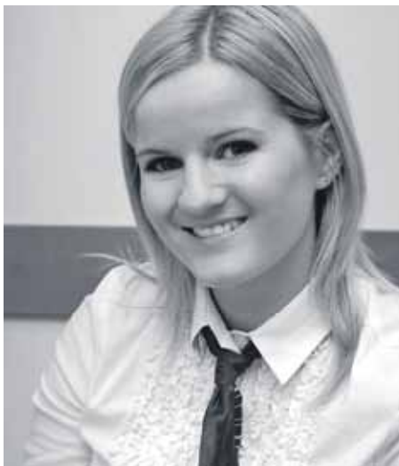
Kierownik placówki Kasy Stefczyka w Kętach.

– Pożyczka na każdą pogodę jest jak kapelusz na słońce i parasol na deszcz. Pomaga radzić sobie w zmiennych okolicznościach. Pozwala realizować cele, gdy warunki bywają kapryśne. To sprawdzone rozwiązanie finansowe, na które można liczyć. Za pożyczką na każdą