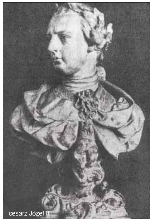
cesarz Józef II