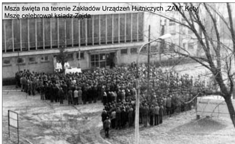
Msza święta na terenie Zakładów Urządzeń Hutniczych „ZAM” Kęty Mszę celebrował ksiądz Zajda

przejawom nadużyć i pospolitych przestępstw ludzi ówczesnego aparatu władzy, funkcjonariuszom komitetów - miejskiego i wojewódzkiego oraz milicji.