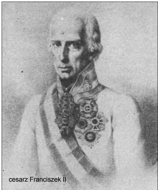
cesarz Franciszek II

W dniu 5 sierpnia 1772 Rosja, Prusy i Austria dokonały pierwszego rozbioru Rzeczypospolitej, nękanej od wielu lat głębokim kryzysem politycznym i gospodarczym. Wojska Habsburgów zajęły południową Małopolskę jeszcze w połowie 1772 roku, kiedy Rosjanie rozbijali ostatnie punk-