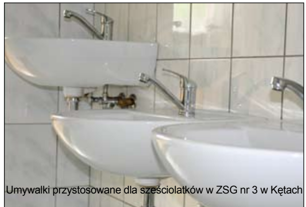
Umywalki przystosowane dla sześciolatków w ZSG nr 3 w Kętach