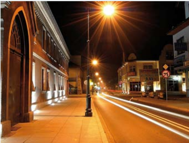
Klasztor autor: Mariusz Miodek