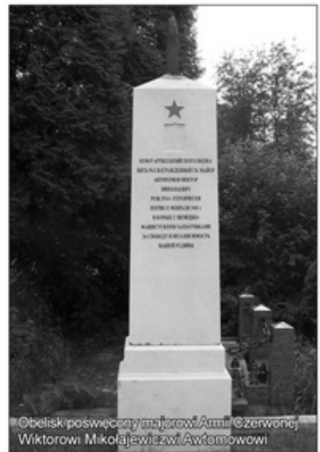
Obelisk poświęcony majorowi Armii Czerwonej, Viktorowi Mikołajewiczowi Awtomowowi