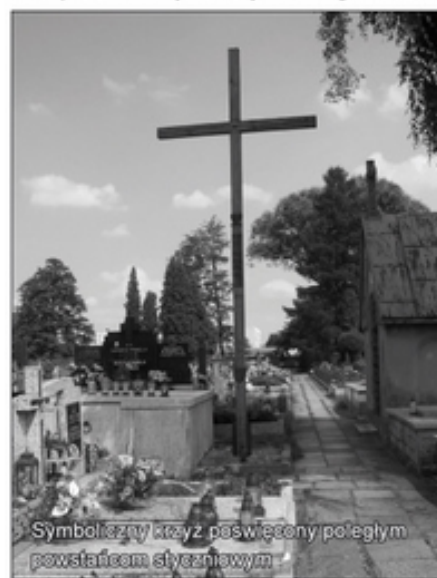
Symboliczny krzyż poświęcony poległym powstańcom styczniowym

międzywojennym płytą pamiątkową ufundował kęcki oddział Związku Legionistów Polskich. Pod płaskorzeźbą legionowego orła widnieje napis: „Bóg Honor Ojczyzna Legionistom Mieszkańcy Kęt”. Niestety stan grobowca, nawet pomimo podjętych w 2003 roku prac renowacyjnych, nie jest najlepszy. W nowszej części nekropolii występuje bezimienna kwatery wojenna polskich żołnierzy z okresu I wojny światowej. Złożono w niej szczątki żołnierzy zmarłych w szpitalu, któ-