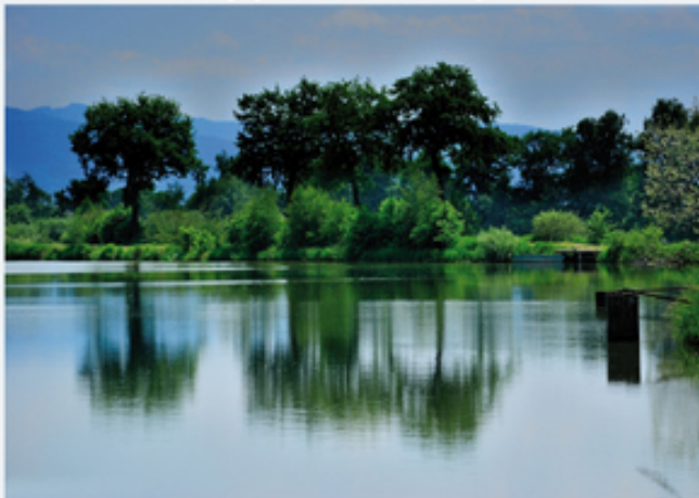
Staw w Malcu