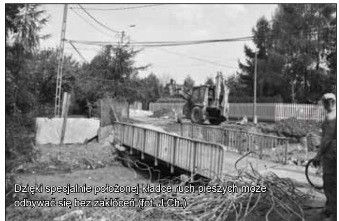
Dzięki specjalnie położonej kładce ruch pieszych może odbywać się bez zakłóceń