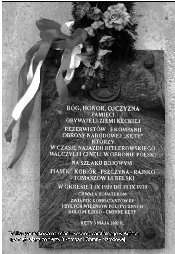
Tablica pamiątkowa na ścianie kościoła parafialnego w Kętach upamiętniająca żołnierzy 3 kompanii Obrony Narodowej.

W obliczu napiętej sytuacji politycznej, w ostatnim tygodniu sierpnia 1939 roku polskie dowództwo wydało dyrektywy o przeprowadzeniu mobilizacji sił zbrojnych. Zmobilizowano również oficerów