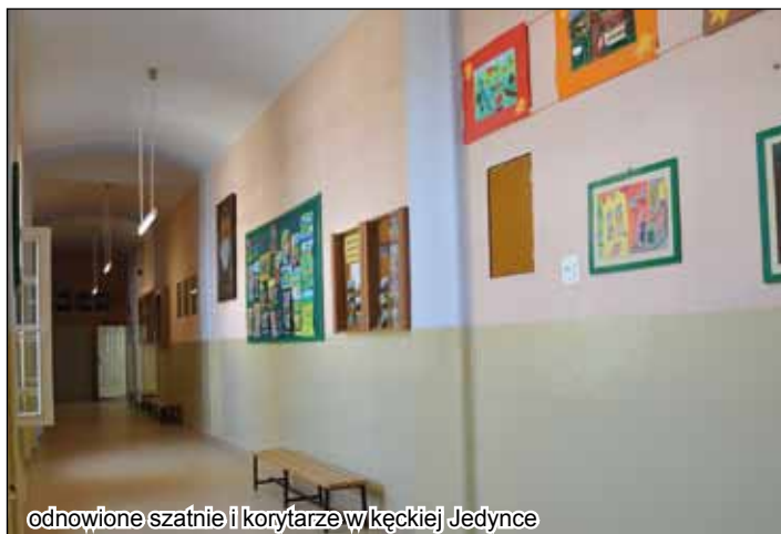
odnowione szatnie i korytarze w kęckiej Jedynce