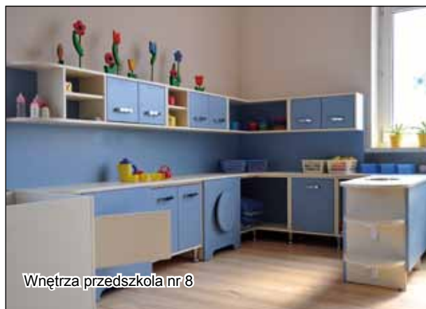
Wnętrze przedszkola nr 8

drzwi, oddzielające korytarz główny od sal nauczania zintegrowanego. Dla oddziału zakupiono również obudowy na grzejniki oraz szafę RTV. Wykonano poprawki malarskie w siedmiu salach lekcyjnych i zakupiono re-