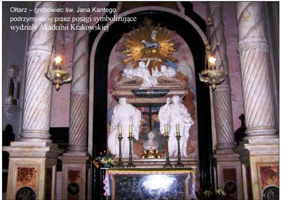
Ołtarz – grobowiec św. Jana Kantego podtrzymywany przez posągi symbolizujące wydziały Akademii Krakowskiej

W ołtarzu głównym kolegiaty zaprojektowanym przez Baltazara Fontanę występuje obraz patronki świątyni – św. Anny z Dzieciątkiem. Namalował go nadworny malarz króla Jana III Sobieskiego – Jerzy Eleuter Siemiginowski. W nawach bocznych krakowskiej kolegiaty umieszczono po trzy kaplice z obydwu stron. Po lewej stronie znajdują się kaplice: św. Piotra, św. Katarzyny Aleksandryjskiej i św. Sebastiana, natomiast po prawej kaplice: św. Jana Chrzciciela, Niepokalanego Poczęcia Naj-