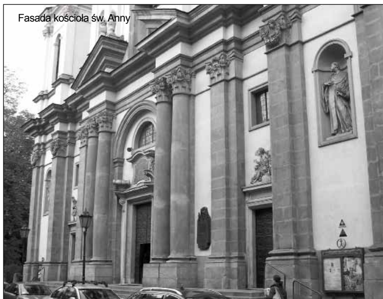
Fasada kościoła św. Anny

Do prac nad nową świątynią sprowadzono najlepszych europejskich artystów. Głównym projektantem kościoła był Tylman z Gameren – nadworny architekt króla Michała Korybuta Wiśniowieckiego. Pochodzącego z Holandii twórcę uważano za jednego z najwybitniejszych przedstawicieli późnego baroku w Europie. Tylman z Gameren zasłynął z projektowania rezydencji czołowych polskich rodów możnowładczych – pałaców: Brühla, Kraśińskich, Czapskich, Radziwiłłów, wybudowanych w Warszawie, a także pałaców: Branicznych w Białymstoku oraz Lubomirskich w Rzeszowie. Spod ręki Holendra wyszły również plany architektoniczne obiektów sakralnych, wśród nich można wymienić: kościół Bernardynów na Czernikowie w Warszawie,