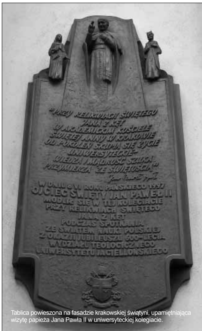
Tablica powieszona na fasadzie krakowskiej świątyni, upamiętniająca wizytę papieża Jana Pawła II w uniwersyteckiej kolegiacie.