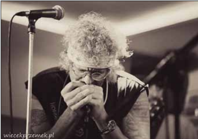
Bluesowa noc w kęckim Domu Kultury