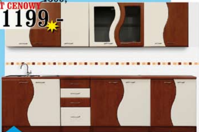
Zestaw kuchenny FALA wymiary 260 kolor wanilia-calvados, wanilia-orzech, fronty MDF

Komplet wypoczynkowy RETRO wym. wersalki 220/95/90 +2 fotele 80/75/95, pow. spania 190/120 sprężyny typu bonell, lite drewno ozdobnie wykończone