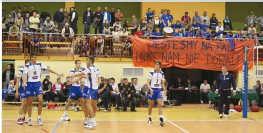
UMKS „Kęczanin” Kęty 3:0 KS Błękitni Ropczyce

Po łatwym zwycięstwie nad Ropczycami, Kęczanina czekały dwie, ciężkie przeprawy na wyjeździe – niestety, obie zakończone przegraną.