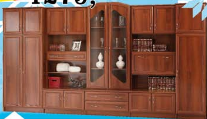
Meblościanka OMAR wymiary 370/217/49 kolor orzech, olcha