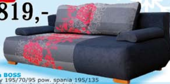
kanapa BOSS wymiary 195/70/95 pow. spania 195/135 automatyczny system rozkładania, na sprężynach typu bonell, kolory: graphit, gray, pojemnik na pościel