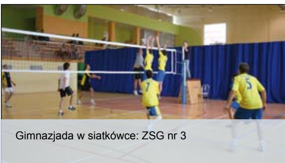
Gimnazjada w siatkówce: ZSG nr 3

Listopad dla uczniów upłynął pod znakiem sportowej rywalizacji. Na hali OSiR-u mogliśmy podziwiać zmagania gimnazjalistów w siatkówce, koszykówce szczebla gminnego czy piłce ręcznej szczebla powiatowego.