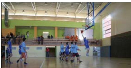
Gimnazjada w koszykówce: ZSP Bulowice - ZSG Nowa Wieś

Kęcka „Dwójka” to nadal najbardziej wysportowana szkoła w Kętach. Dobrą postawą wykazała się także na gminnej Gimnazjadzie w koszykówce. Prawdziwe sukcesy przysły w połowie miesiąca. Na hali sportowej w Chełmku uczniowie ZSG nr 2 wywalczyli po raz pierwszy w historii awans do turnieju finałowego w piłce ręcz-