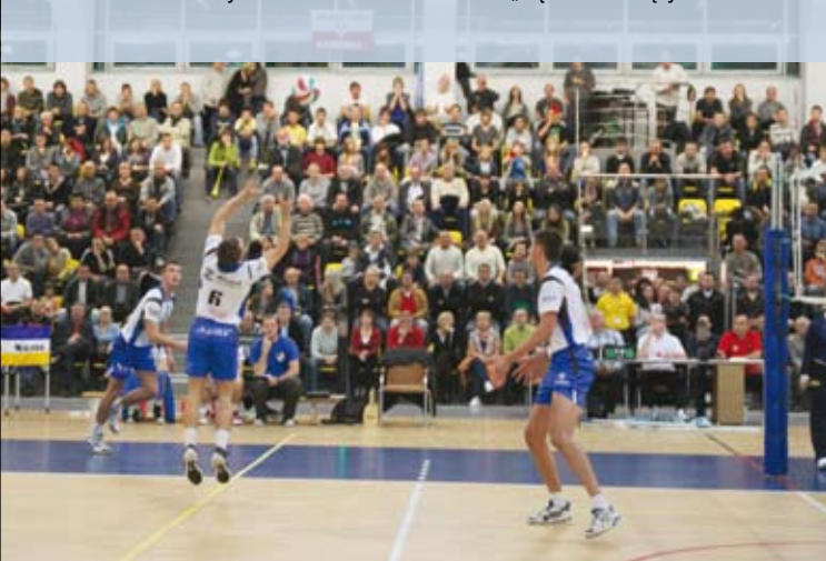
STS Skarżysko-Kamienna 3:1 UMKS „Kęczanin” Kęty