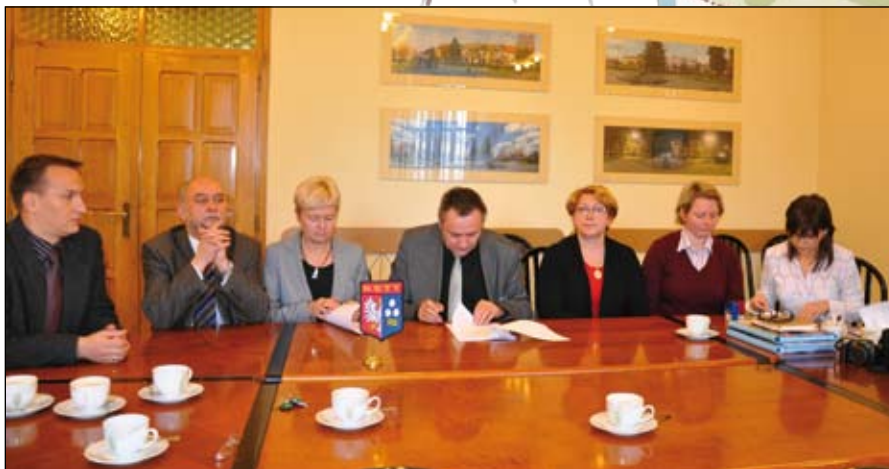
◀ Podpisanie umowy na budowę obwodnicy południowo-zachodniej w sali narad kęckiego Urzędu Gminy