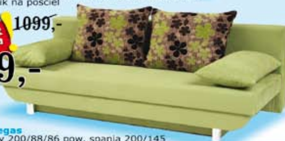
sofa Vegas wymiary 200/88/86 pow. spania 200/145 automatyczny system rozkładania, na sprężynach typu bonell, różne kolory, pojemnik na pościel