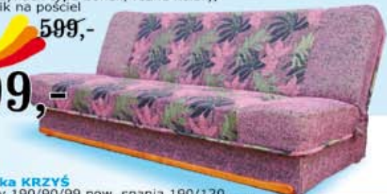
wersalka KRZYŚ wymiary 190/90/99 pow. spania 190/120 na sprężynach typu bonell, tkanina szeńil stokowy ozdobna, drewniana listwa wykończeniowa, pojemnik na pościel