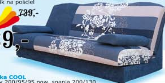
wersalka COOL wymiary 200/95/95 pow. spania 200/130 na sprężynach typu bonell, kolory: graphit, gray pojemnik na pościel