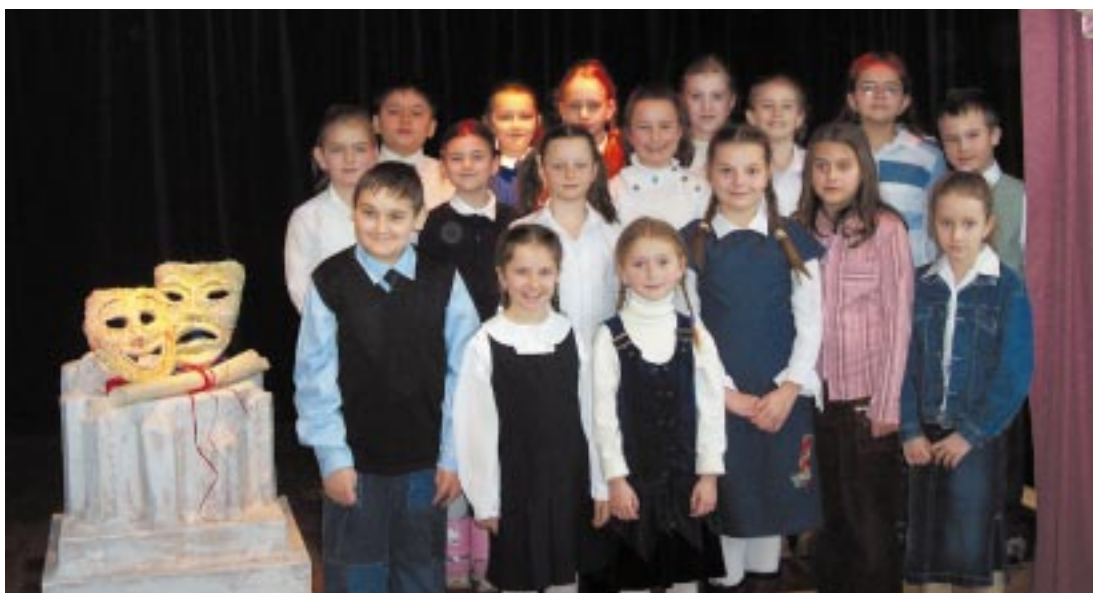
Na zdjęciu uczestnicy Międzyszkolnego Konkursu Recytatorskiego w Domu Kultury w Kętach. Młodzi recytatorzy z gminy Kęty potwierdzili swoje zdolności artystyczne i dobre przygotowanie podczas eliminacji powiatowych Wojewódzkiego Konkursu Recytatorskiego w Oświęcimiu. Wyniki prezentujemy na str. 15.

KĘTY, ul. Kościuszki 2, tel. 033/845 13 09 Infolinia: 0-801 602 222 www.skokpiast.pl