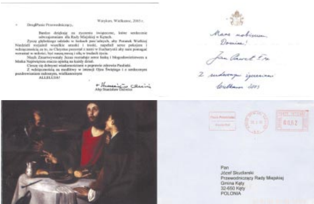
Ostatnia korespondencja od Papieża Jana Pawła II skierowana do przewodniczącego Rady Miejskiej w Kętach Józefa Skudlarskiego