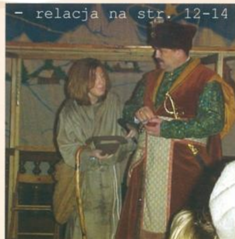
Jasełka w klasztorze OO. Franciszkanów