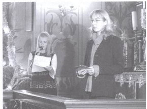
Uczniowie LO im. St. Wyspiańskiego zaangażowali się recytację wierszy