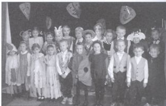
Fot. Przedszkolaki zaprezentowały się w teatrze jednego aktora. Fot. (nik).

Final kęckiej Olimpiady Przedszkolnej przewidziano na czerwiec. Będzie on imprezą towarzyszącą obchodom Dni Kęt. Wówczas to przedszkola otrzymają nagrody - zabawki i pomoce dydaktyczne.