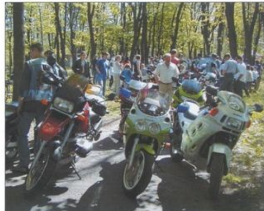
Na zlot motocyklistów do Bielan zjechało ponad stu zapaleńców z całej okolicy.

Kawalkada wspaniałych maszyn zatrzymała się na chwilę na bielańskim Rynku. Liczne zgromadzeni mieszkańcy gminy Kęty i nie tylko bardzo chętnie robili sobie zdjęcia przy wspaniałych dwukółowcach. Po paradzie wszyscy pasjonaci dwóch zmotoryzowanych kółek wrócili do parku nad Sołą na za-