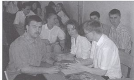
Drużyna z Gimnazjum w Nowej Wsi zdobyła w Chelмку drugie miejsce.