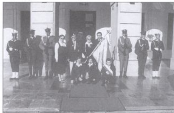
Delegacja SP 2 im. Bohaterów Monte Cassino w Kętach przed pałacem Prezydenta RP.