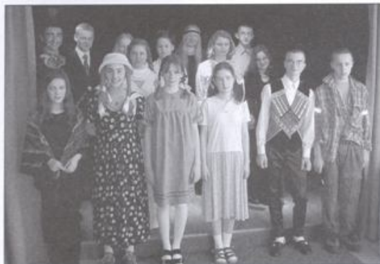
Na scenie sali kameralnej zaprezentowało się 15 młodych aktorów. Fot. (nik)

Laureaci konkursu otrzymali nagrody książkowe. Finał tegorocznej Ligi Gimnazjalnej wpisano do kalendarza imprez towarzyszących Dniom Kęt. Wtedy to dowiedziemy się, która ze szkół otrzyma Puchar Przechodni. Przez dwa lata z rzędu jego zdobywcą było Gimnazjum nr 2 w Kętach.