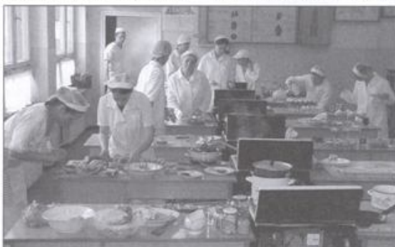
Uczniowie CKD podczas egzaminu praktycznego dali prawdziwy popis sztuki kucharzkiej.

- Egzaminowali to pierwsza grupa uczniów, którzy kończą tę właśnie