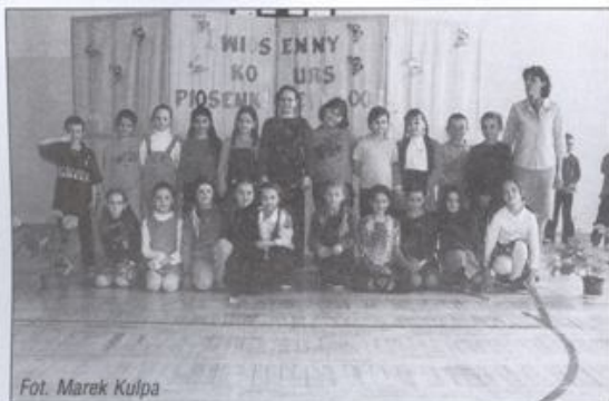
Fot. Marek Kulpa