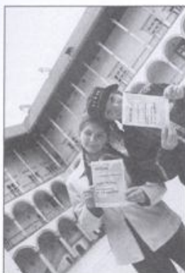
Laureatki na Wawelu.