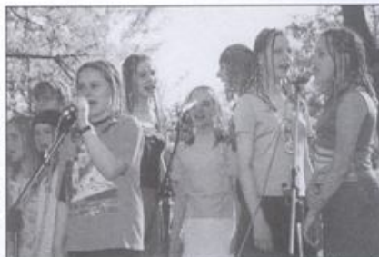
Piknik rodzinny 4 maja 2002r. „Promyki Serca” podczas koncertu promującego płytę „Jeruzalem”.