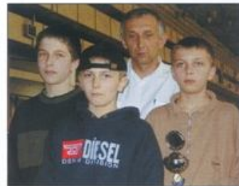
Ekipa ze Szkoły Podstawowej w Malcu była druga.