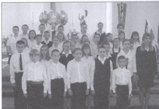
Wspaniały program artystyczny z okazji jubileuszu nadania imienia Szkoły Podstawowej nr 2 przedstawił piąto- i szóstoklasiści.

Po nabożeństwie dzieci z klas V i VI zaprezentowały przygotowany przez polonistów Jolanę Kołodziejczyk i Grażynę Małyse oraz muzyka Marka Bakalarskiego niezwykle sugestywny i wzruszający program poetycko-muzyczny. Scenografię zarówno do przedstawienia, jak i innych punktów progra-