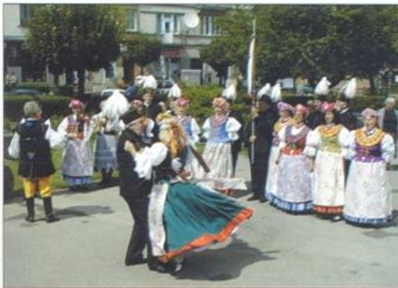
ZPiT Kety.