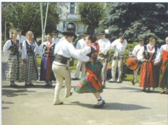
Zespół góralski z Kościeliska.