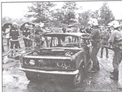
Strażacy z OSP w Kętach dali pokaz gaszenia samochodu.

Drugiego dnia zorganizowano piłkarski turniej żaków im. Władysława Bujarka, pierwszego prezesa Niwy Nowa Wieś. Patronat nad turniejem objął przewodniczący Rady Miejskiej w Kętach Józef Skudlarski. Nie-