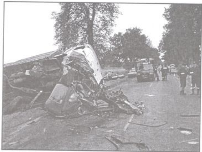
Aż trzy osoby zginęły w tym roku na drogach gminy Kęty.

Brawura i brak wyobraźni kierujących to jedna z głównych przyczyn wzrostu liczby wypadków i ich ofiar.