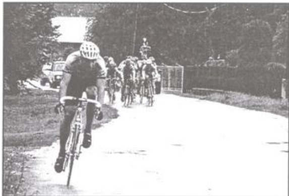
W Malcu odbył się wyścig o Puchar Burmistrza Gminy Kęty.