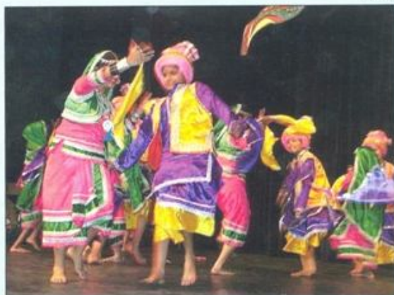
Nrutyeshwar z Bombaju w Indiach.