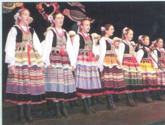
Młoda Karolinka z Wielkiej Brytanii.

Reklamy i ogłoszenia przyjmowane są w Domu Kultury w pok. 122-124 codziennie od 8 do 15