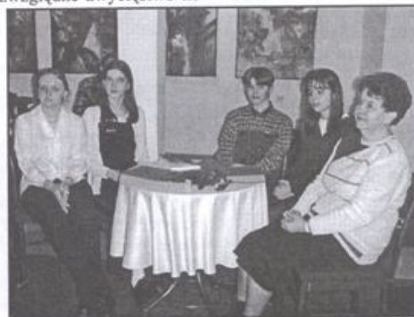
Uczniowie i ich opiekunowie kolejny etap Gimnazjałek maja już za sobą.