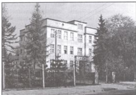
Główny budynek Zespołu Szkół im. M. Dąbrowskiej

-Tak. Historia szkoły sięga 1907 roku. Rozpoczęło wtedy swoją działalność Cesarsko - Królewskie Seminarium Nauczycielskie. Przez ponad 80 lat budynek przy ul. Kościuszki 29 opuszczali absolwenci Seminarium Nauczycielskiego, Liceum Pedagogicznego, Studium Wychowania Przedszkolnego i Studium Nauczycielskiego. Z tą szkołą czuję się szczególnie związana, ponieważ jestem jej absolwentką,