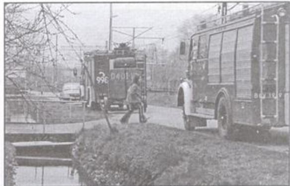
Przy ulicy Krótkiej w Kętach doszło do skażenia rowu drenazowego.