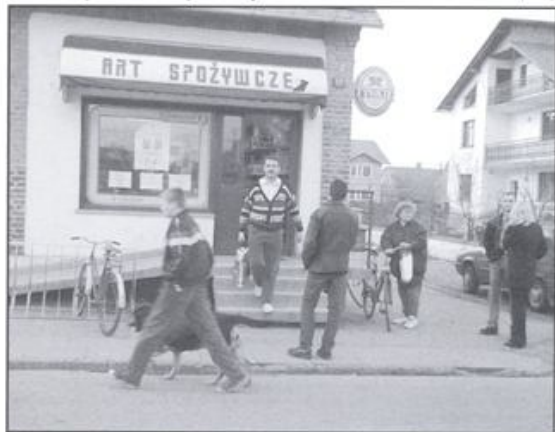
Dwaj zamaskowani mężczyźni dokonali napadu na sklep w Bielanach.