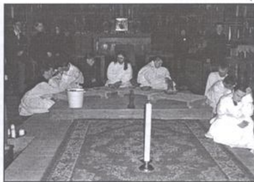
W kościele Ojców Franciszkanów mogliśmy przeżywać Misterium Męki Pańskiej.