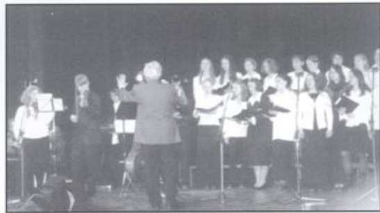
Zespół „Concentus” profesjonalnym wykonaniem i doskonałą aranżacją zapewnił wysoki poziom koncertu pt. „Pieśń Roku Liturgicznego”