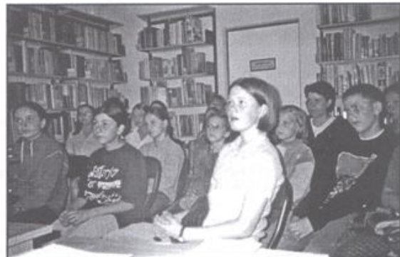
Laureaci konkursu podczas spotkania w bibliotece.

skiego w Kętach zostali wyróżnieni podczas konkursu spektakli poświęconych pamięci pomordowanych Polaków na Wschodzie. Prezentacja nagrodzonych spektakli szkolnych, poświęconych 60. rocznicy zbrodni katyńskiej odbyła się w sali widowiskowej Oświęcimskiego Centrum Kultu-