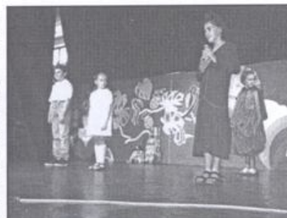
W Domu Kultury zakończyły się Gimnazjalni, SzPA-K i Olimpiada Przedszkolna.

W olimpiadzie brały udział przedszkola nr 1, 5, 6, 7, 8 i 9 w Kętach oraz przedszkola z Bielan i Bulowic. Wszystkie drużyny