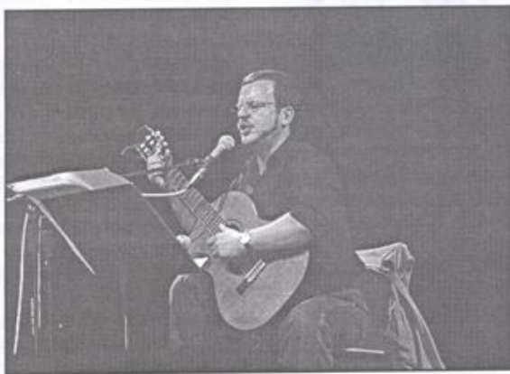
Jacek Kaczmarski na koncercie w kęckim Domu Kultury.