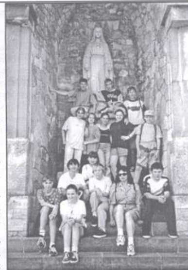
Zdjęcie pamiątkowe z Mety Rajdu w Czernej - gimnazjaliści z Bulowic.

Gratulujemy wszystkim pogody ducha i turystycznego zacięcia.