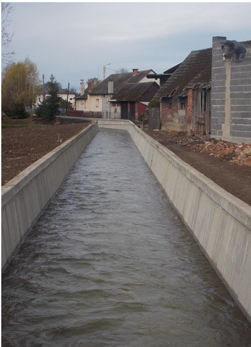
Młynówka Czaniecka w km 2+325-2+498