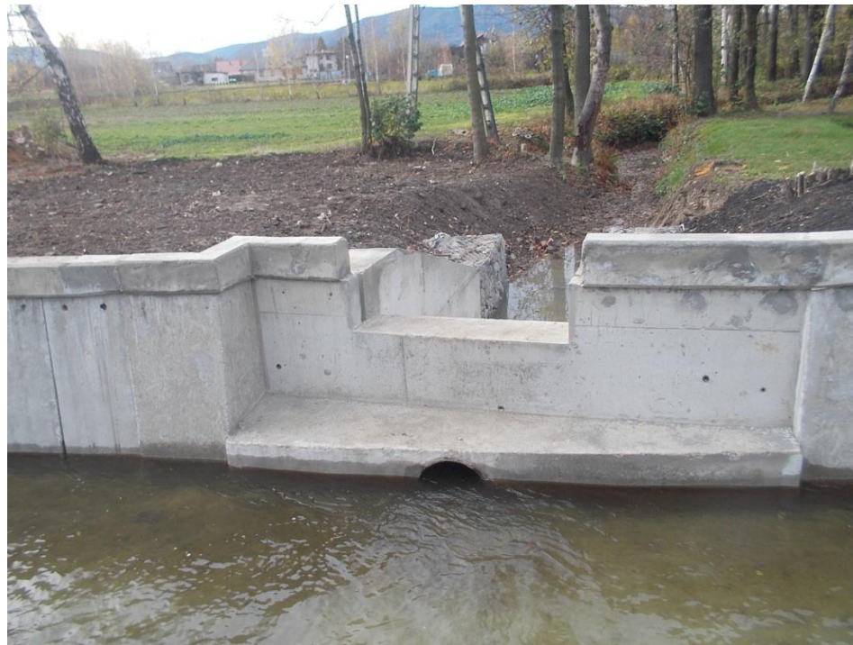
Przelew boczny w km 0+526