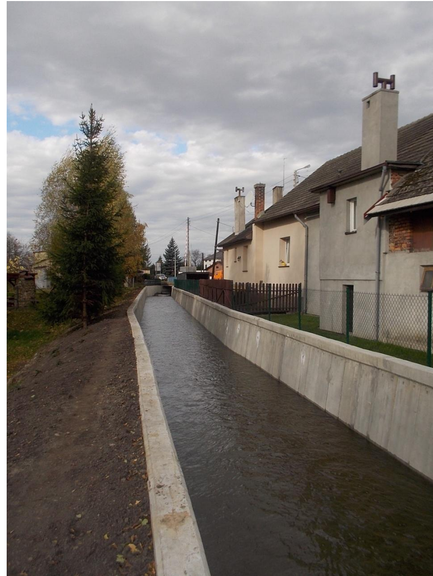
Młynówka Czaniecka w km 2+325-2+498