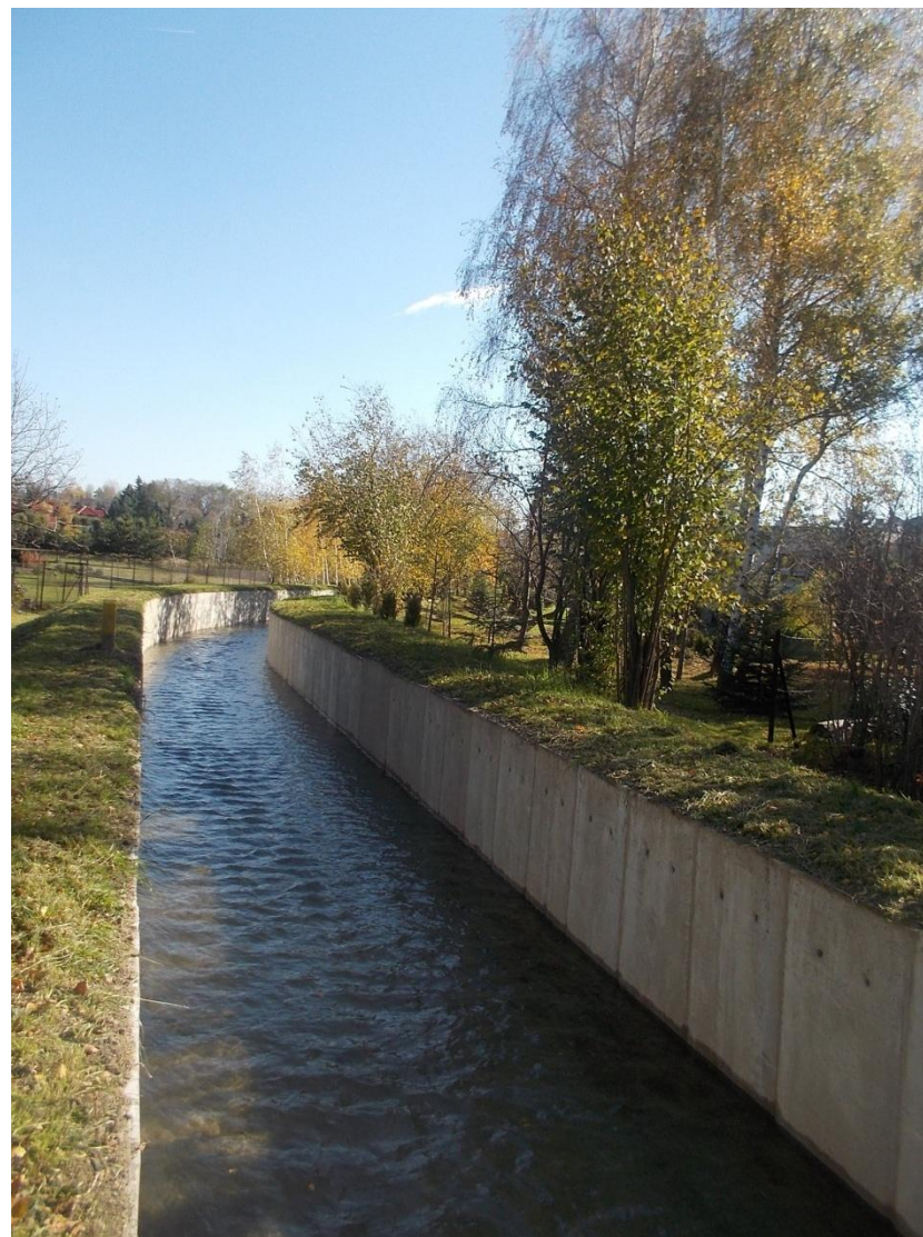
Młynówka Czaniecka w km 2+039-2+282