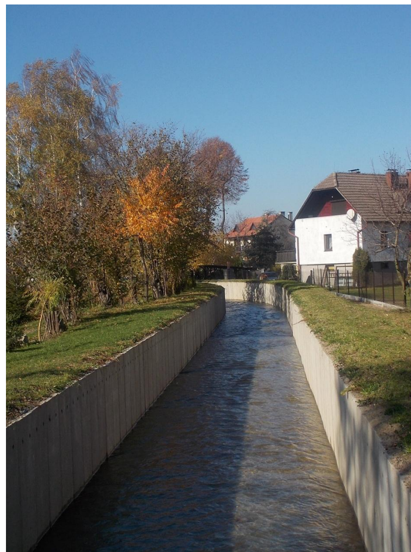
Młynówka Czaniecka w km 2+039-2+282