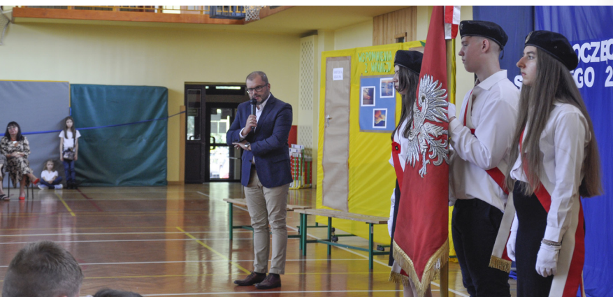
ROZPOCZĘCIE ROKU SZKOLNEGO W SP NR 2 W KĘTACH