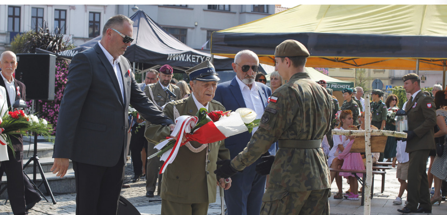
85. ROCZNICA WYBUCHU II WOJNY ŚWIATOWEJ