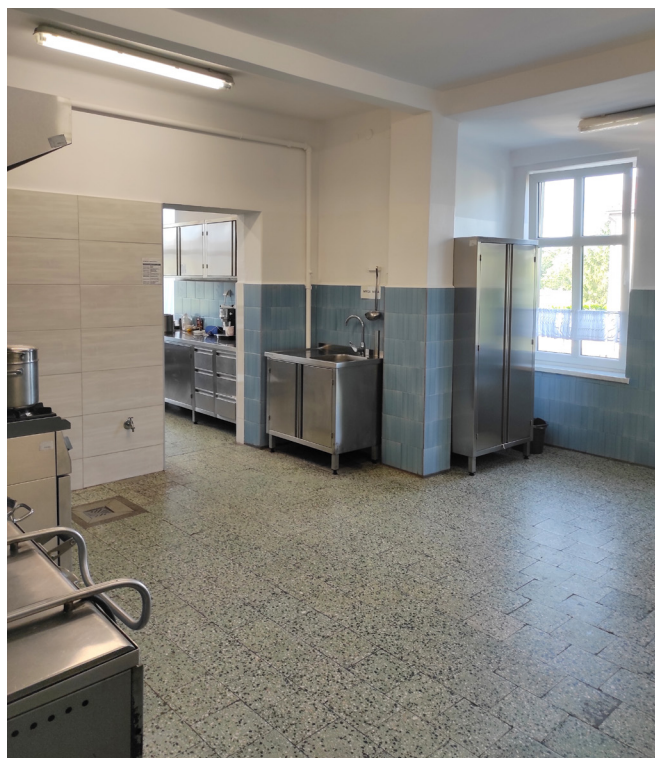
Kuchnia w SPWP nr 9 w Kętach po malowaniu