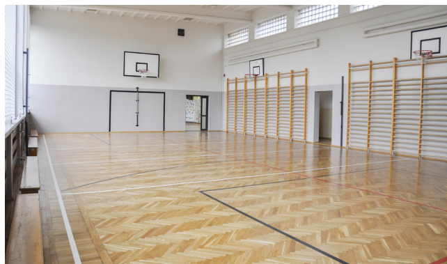
Sala gimnastyczna w SP w Nowej Wsi

Rozmawiała Barbara Kuźma-Suazo / fot. z archiwum UG Kęty