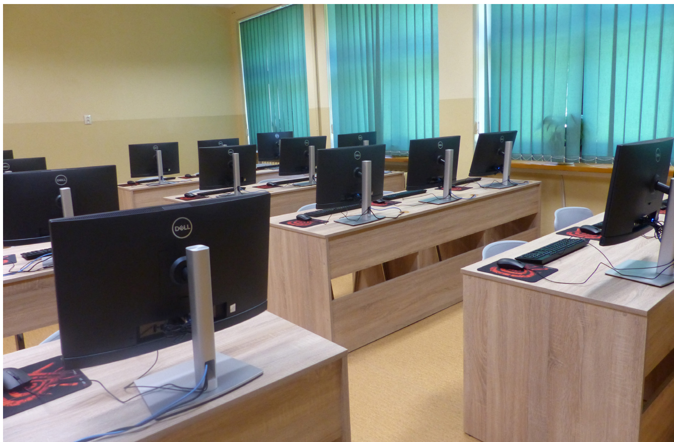
Sala komputerowa w ZSP nr 3 w Kętach Podlesiu

Inną rzeczą, która nigdy się nie kończy, jest wymiana stolarki okienneo-drzwiowej. Placówki mamy w różnym stanie, bo budowane były w różnych latach. Jedną z bardziej charakterystycznych jest Szkoła Podstawowa nr 2 w Kętach. Ilość okien jest olbrzymia, więc sam nie wiem, kiedy skończymy ich wymianę. A trzeba dodać, że okna muszą spełniać określone normy techniczne. Kilka lat temu były to okna plastikowe dwuszybowe, pięcio czy siedmiogrodziowe. Teraz zmieniły się normy – okna muszą być trzyszybowe. I na takie właśnie wymieniliśmy w te wakacje szesnaście okien, co kosztowało prawie sto czterdzieści tysięcy zł. To kwota niebagatelna, a jednocześnie – kropla w szkolnym morzu potrzeb.