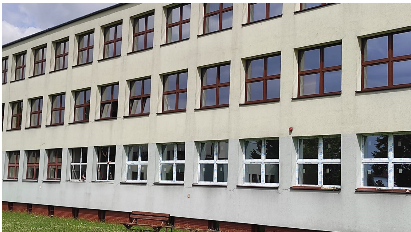
Nowe okna w SP nr 2 w Kętach

Oczywiście w wielu placówkach dyrektorzy dokonują bieżących napraw jak np. wymiany grzejników w Bielanych. Dokonujemy większych i mniejszych remontów, ale co ważne chcemy realizować najpilniejsze potrzeby, jak np. montaż klimatyzatorów. Pamiętajmy, że w przeciwieństwie do szkół, przedszkola w okresie wakacji pracują. Są dyżury wakacyjne,