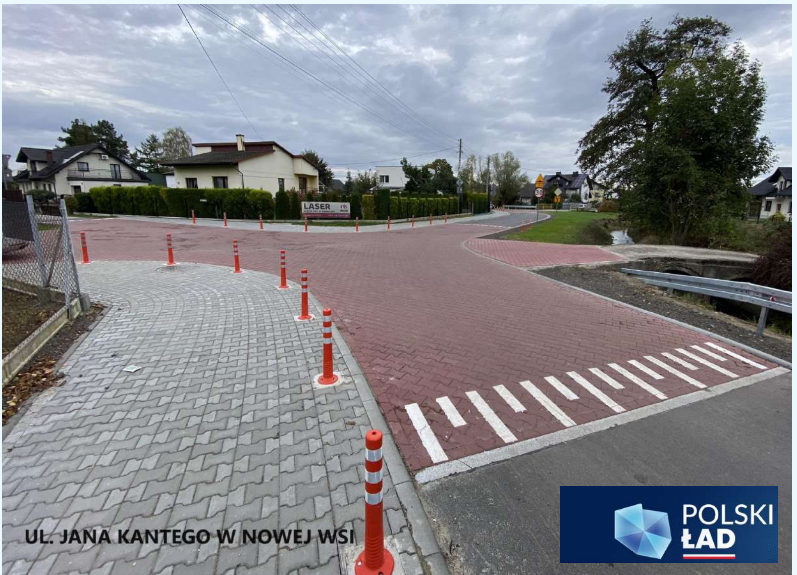
UL. JANA KANTEGO W NOWEJ WSI