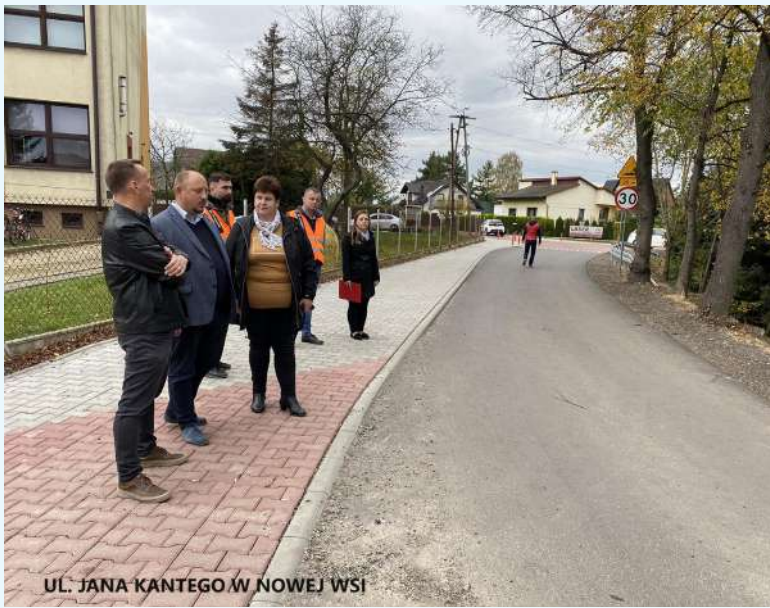
UL. JANA KANTEGO W NOWEJ WSI