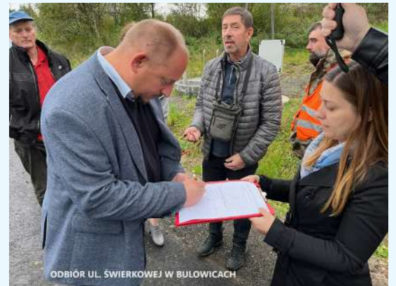
ODBIÓR UL. ŚWIERKOWEJ W BULOWICACH