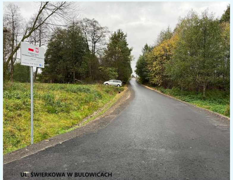
UL. ŚWIERKOWA W BULOWICACH