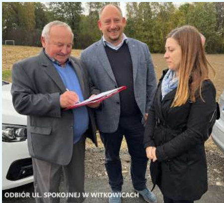
ODBIÓR UL. SPOKOJNEJ W WITKOWICACH