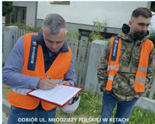
ODBIÓR UL. MŁODZIEŻY POLSKIEJ W KETACH